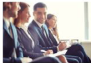
Spotkania otwarte konsultacyjne