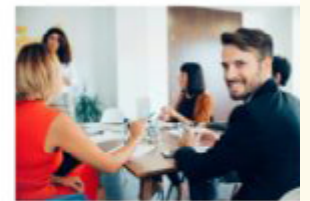
Plenerowe spotkania informacyjne

Сайт, проекти, ідеї, інформація... для людей, а не для голови облдержадміністрації, чи повіту, не для моніторингових комісій, не для просто щоб був.