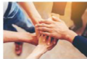
Nabór projektów rewitalizacyjnych – ankieta konsultacyjna